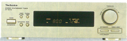
FM/AM ステレオチューナー