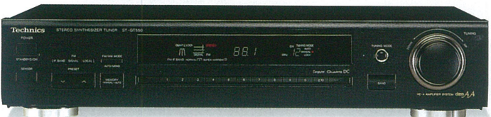
クォーツシンセサイザ-FM/AM チューナー