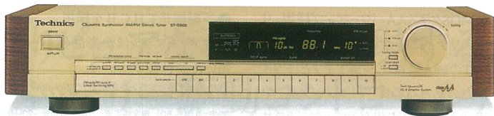
クォーツシンセサイザ-FM/AM チューナー